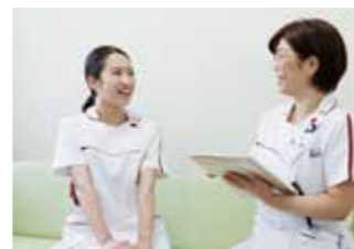
15:00 今日は看護師長との 定期面接です