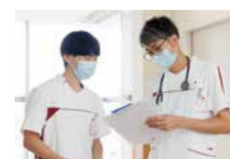
11:00 先輩はいつでも 相談にのってくれます