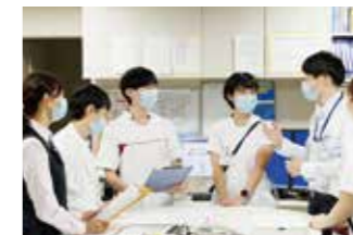
9:00 多職種カンファレンスに 参加します