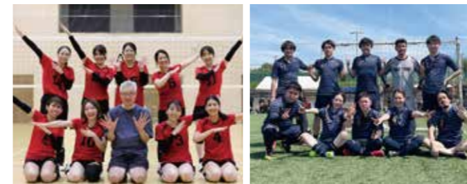
赤十字スポーツ大会(中部ブロック、全国)

バレーボール部、テニス部、 フットサル部、バスケットボール部、野球部、マラソン部、 写真部、囲碁部