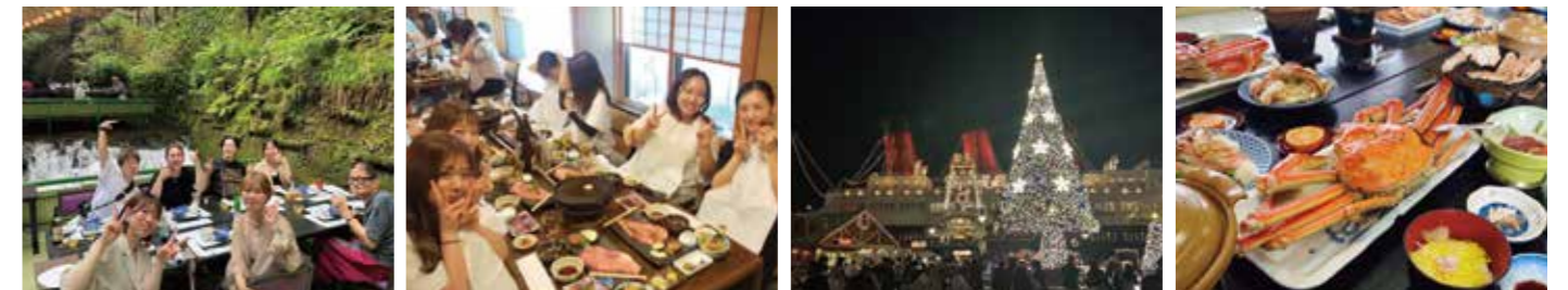
貴船神社参拝後、川床料理を食す