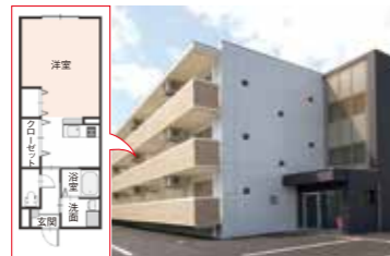
職員寮 カーサルナ