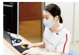
13:00 タイムリーに 看護記録を記載します