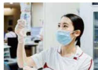
9:00 点滴の準備をします