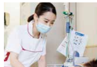
8:30 今日の担当患者さんに 挨拶をします