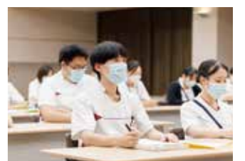
15:00 今日は研修があるので 出席します