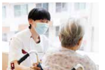
10:00 患者さんの思いを伺います